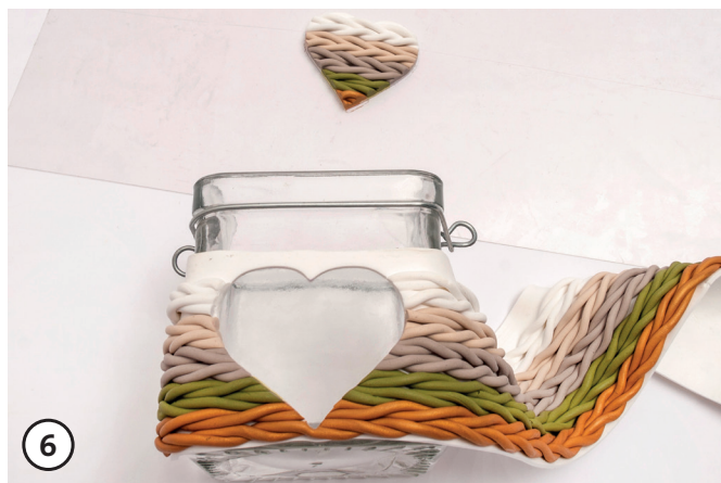
6 (Fimo) 'gebreide' band op het windlicht plaatsen en aanpassen.