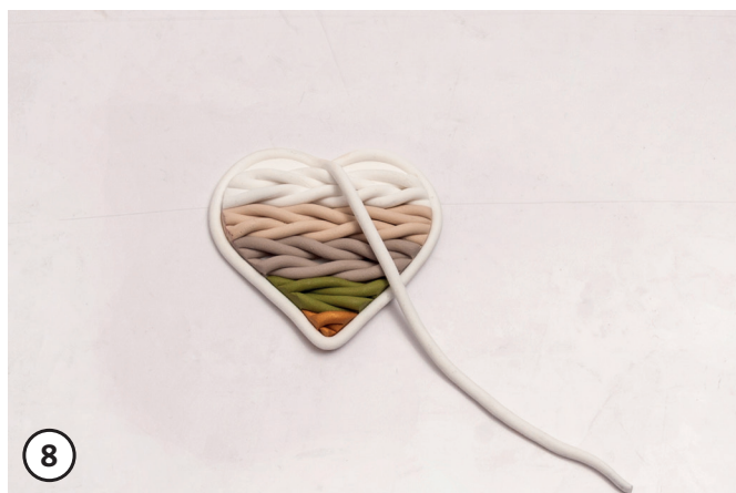
8 Om het uitgestoken Fimo hart ook een koord leggen en aandrukken. Om het te kunnen ophangen, een gat in het model maken (satéprikker). Alle Fimo modellen op een bakplaat met bakpapier leggen. Modellen op 110° C voor c.a 30 minuten in de oven bakken. Uit de oven halen en aan de lucht laten afkoelen. De Fimo 'gebreide' hanger kan met een lint aan het windlicht of aan een takje gehangen worden.